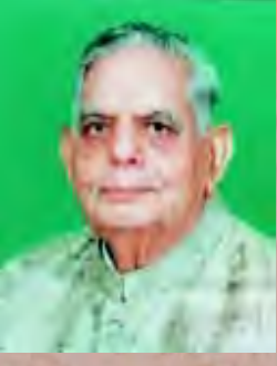
નવલ કિશોર શર્મા રાજ્યપાલ, ગુજરાત