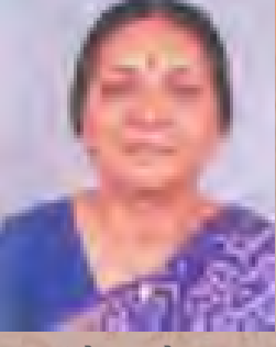
આનંદીબેન પટેલ શિક્ષણ મંત્રી, ગુજરાત રાજ્ય